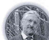
MASSIMO TAVOLA SECONDARIA DI PRIMO GRADO