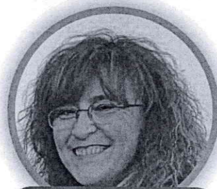
MARIANGELA MAPELLI SCUOLA PRIMARIA